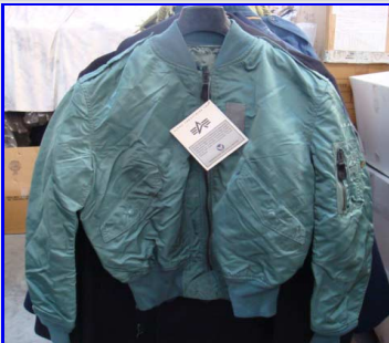
Bomber L2A anni '50 Vintage Made in USA